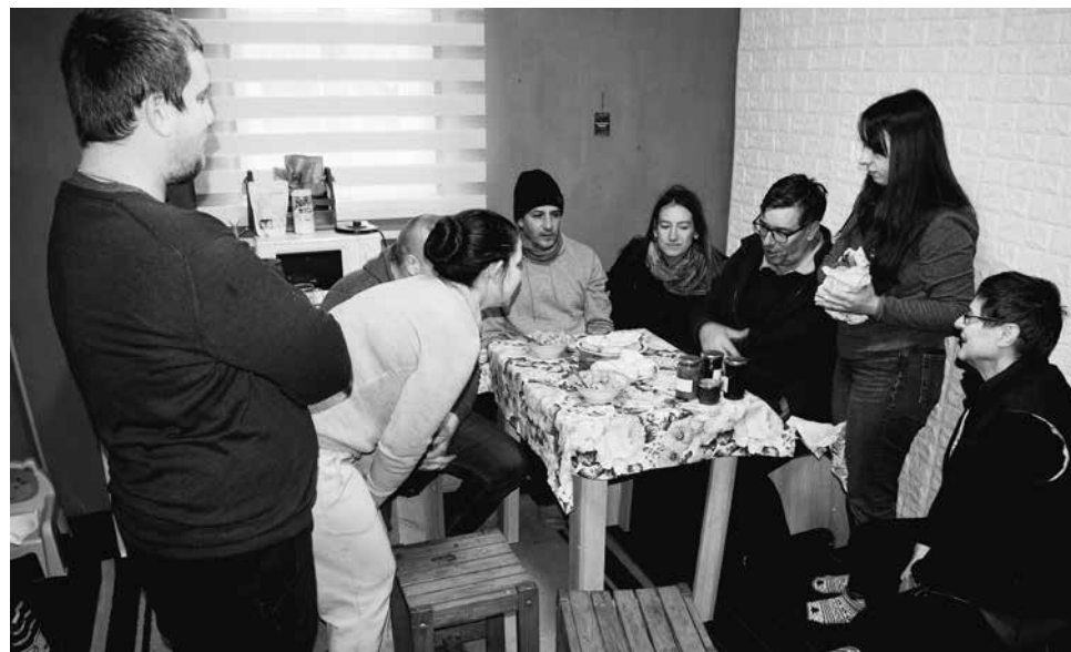
De vrijwilligers in Niznjé Selisjtsjé en mensen van de Longo maï monitoring groep proeven de eerste conserven van de groenten uit de tuinkassen.