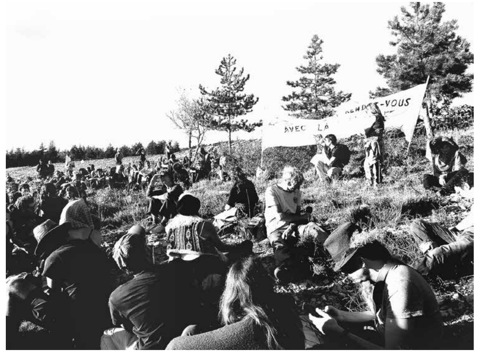
Op het spandoek staat: "De zon heeft een rendez-vous met smerig geld".

Het PV-project van de Canadese multinational Boralex in Cruis is in een vergevorderd stadium. Dorpbewoners waarschuwen ons begin september 2022. De ontbossing is begonnen. Het vreedzame protest van ongeveer veertig mensen kan niets tegenhouden. Zelfs niet wanneer mensen de bomen met hun lichaam tegen de kettingzagen beschermen en er inklimmen. Een van deze bomen wordt omgezaagd in het bijzijn van gendarmes. De val