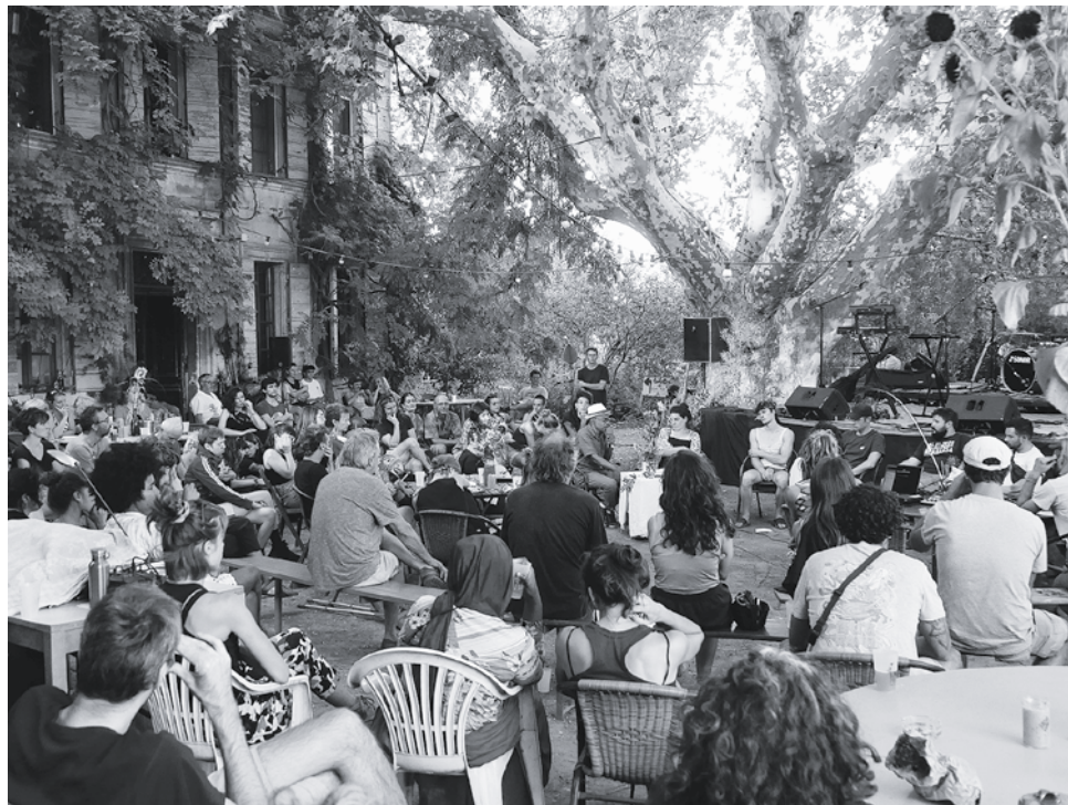
Boeiende paneldiscussie onder monumentale platanen

Het jaarlijkse feest op de Mas de Granier onder de majestueuze platanen geeft ons altijd een gevoel van zowel eeuwigheid als vergankelijkheid. Afgelopen september hebben we er twee dagen van gemaakt, om meer ruimte te geven aan uitwisseling en diepgaandere gesprekken. Meer dan 400 mensen namen onze uitnodiging aan, sommigen voor slechts een paar uur, anderen voor het hele weekend: mensen uit de buurt, uit Arles, Nîmes of Marseille, vrienden, nieuwsgierigen, marktclanten en compleet nieuwe gezichten. Er waren rondleidingen door de coöperatie en een tentoonstelling van archieven en foto's van de afgelopen decennia van de Mas en de Longo maï-beweging. Een grote tafel met boeken en brochures getuigde van de acties en bijeenkomsten die door de jaren heen in de Mas de Granier zijn georganiseerd. Heerlijk eten en eclectische concerten brachten iedereen in een feestelijke stemming, van de anatolisch-marseillaise elek-