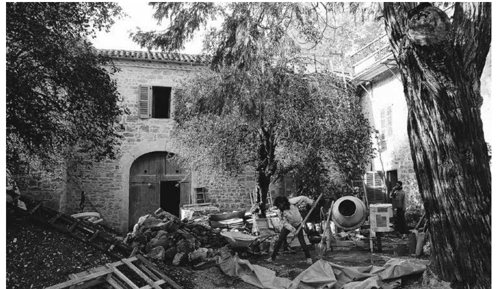
De renovatiewerkzaamheden in Verfeil-sur-Seye zijn in volle gang.

Verfeil en de omgeving: door collectieve initiatieven te blijven uitbreiden (kantine, buurtcafé, spelothek, recyclingcentrum, etc.) en door verbindingen te leggen met andere collectieve initiatieven in andere dorpen en in Toulouse. Terwijl de grote steden ook grote machines zijn voor verarming, ver-