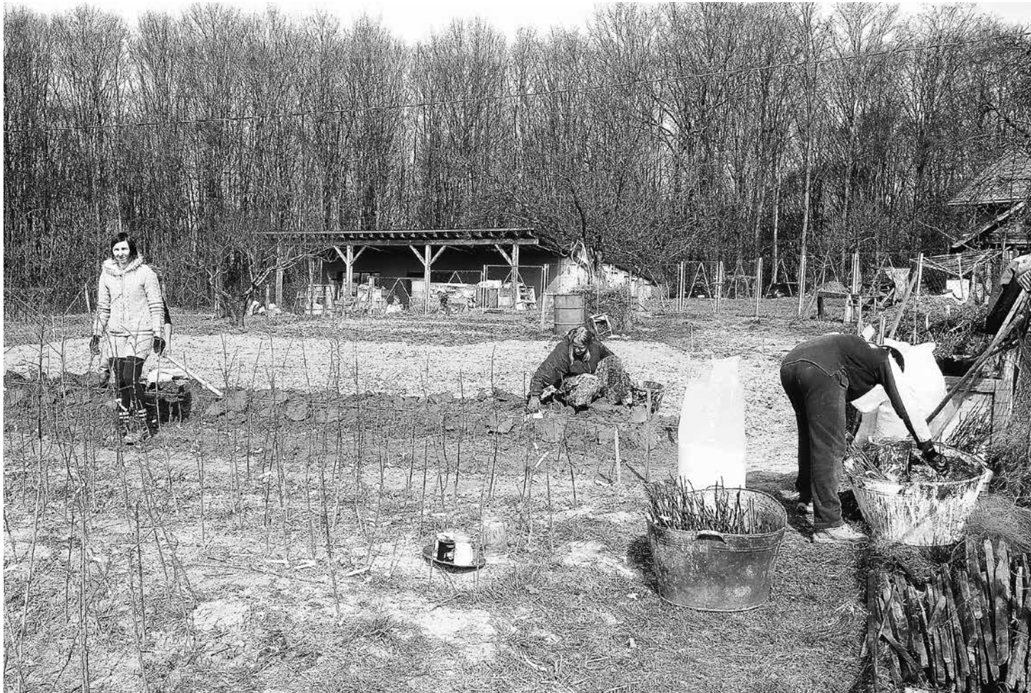
In de Longo maï-coöperatie in Transkarpatië (Oekraïne) ontstaat een kwekerij voor oude fruitsoorten.