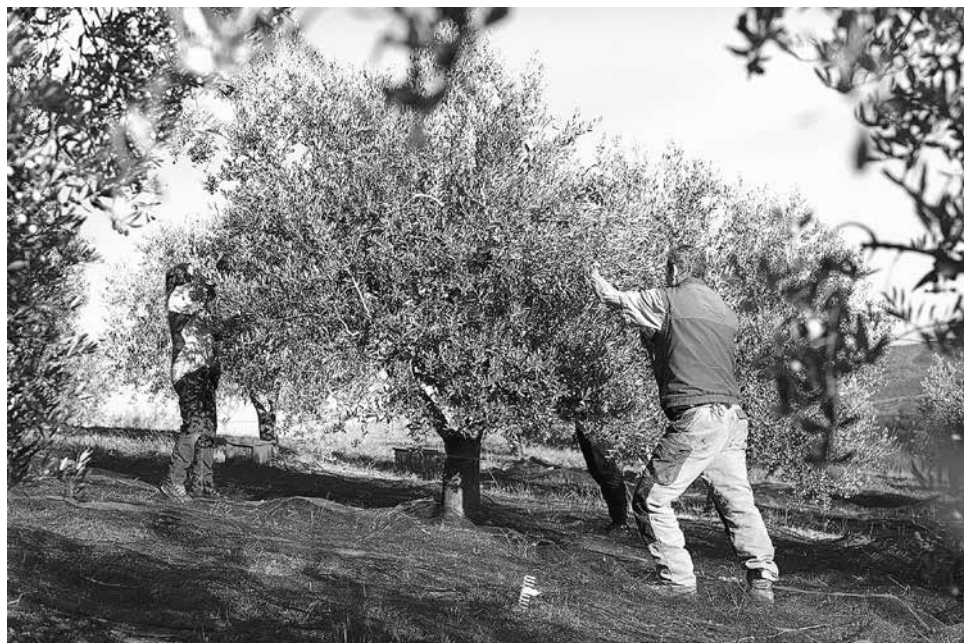
De teelt van olijven is een eeuwenlange traditie in de Provence

Tot nu toe dekten we het grootste deel van onze behoefte in alle coöperaties (1000 liter) met biologische olijfolie uit Andalusië. We krijgen het van de coöperaties van de landarbeiders van de kleine vakbond SOC-SAT, die strijden tegen de