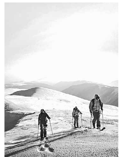
Liever lange trektochten op de ski dan een enorm nieuw skicentrum.