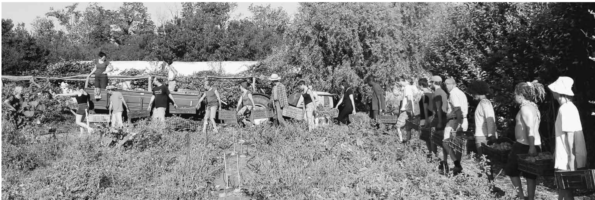
De oogst van inmaaktomaten op de Mas de Granier is elk jaar weer een speciaal moment. Vanuit de andere Zuid-Franse coöperaties komen mensen om mee te helpen bij het plukken en bij het inmaken.