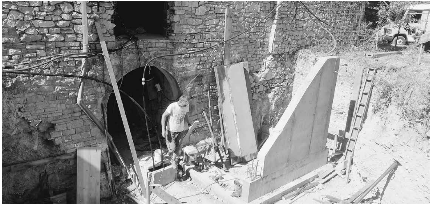
De opbouw van het complex St. Hippolyte in de coöperatie Limans vordert langzaam. Het oude gebouw, waarin we een centrale bibliotheek, cursusruimtes en slaapplekken willen huisvesten, moet worden aangepast aan nieuwe veiligheidscriteria, zoals brandbescherming en vluchtwegen. Dat is gezien de leeftijd van de gebouwen en de ondergrond geen eenvoudige opgave.