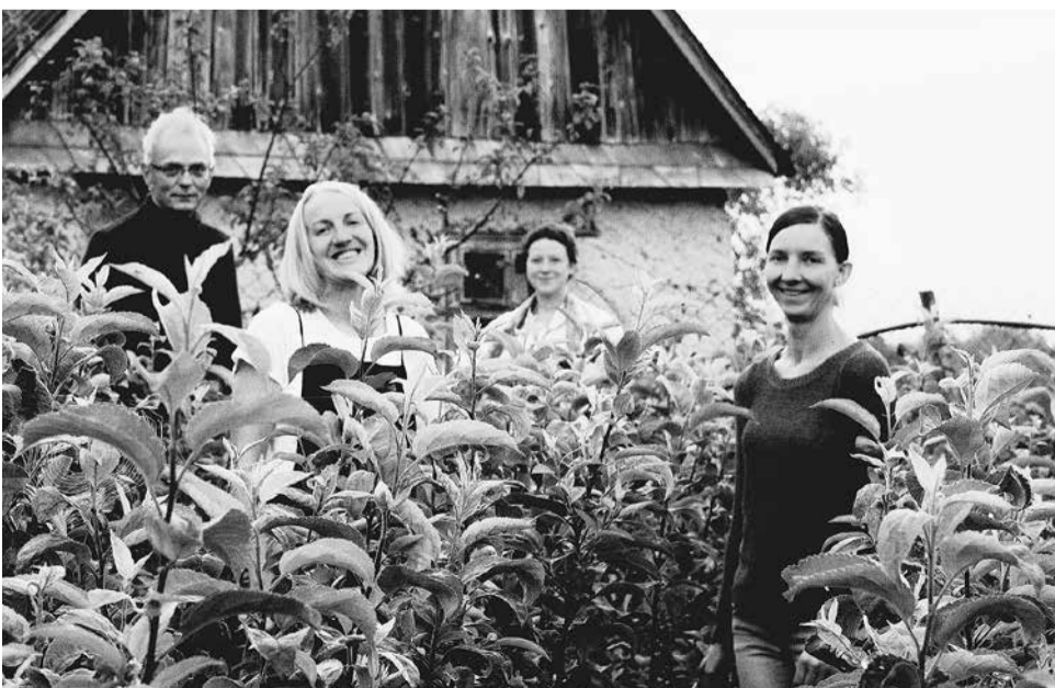
Met toewijding en plezier wordt er in Zeleny Hai voor de jonge appelboompjes gezorgd.

het woord om uit te leggen dat het de uitzonderlijke hoeveelheid regen was die verantwoordelijk was. Volgens hen speelt het slechte beheer van de bossen geen enkele rol in dit drama. Wij zijn ervan overtuigd dat het tegendeel waar is en dat de zogenaamde 'sanitaire kaalslagen' een echte plaag zijn geworden. Zij vormen ook de oorzaak van deze 'natuurramp'. Onder het voorwendsel het bos weer 'gezond' te maken, wordt het schaamteloos gekapt. En dat in deze streek, waar tweederde van de resterende oerbossen van ons continent liggen, essentieel als klimaatstabilisator in Europa. Deze overexploitatie is, of politici het nu leuk vinden of niet, verantwoordelijk voor de overstromingen maar ook, paradoxaal genoeg, voor het droogvallen van de putten van de inwoners van de Karpaten.