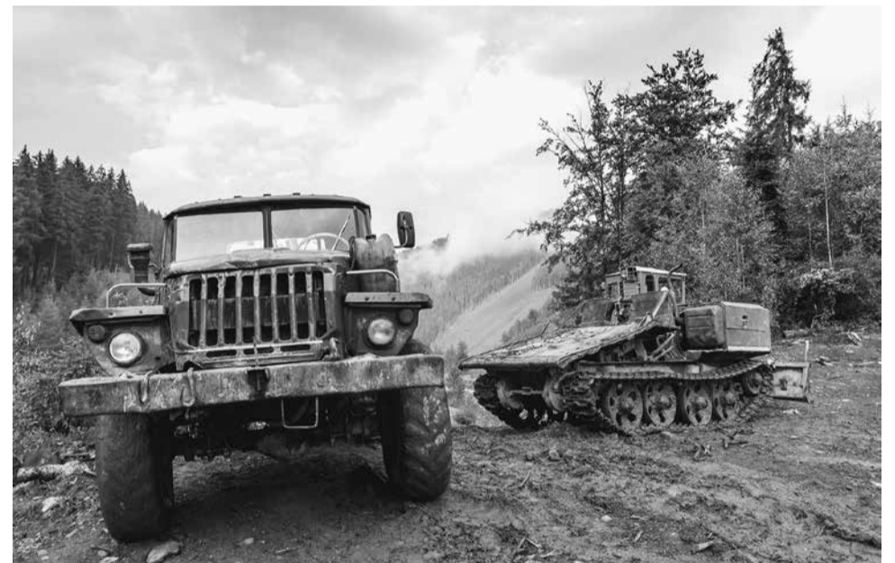
Houtkap in de Karpaten: welke verantwoordelijkheid hebben bedrijven als IKEA voor de verwoesting van het natuurreservaat Svydovets?

Het was een aankondiging van de aankoop van onze boerderij, mogelijk gemaakt door de solidariteit van onze vriendenkring in Zwitserland, Nederland en Frankrijk. Het artikel sprak over de verwoesting van de alluviale vlakte van de Crau tussen Marseille en Arles, over dit unieke te beschermen landschap, het sprak over de ecologische nood situatie als "de ernstigste zaak op dit moment"