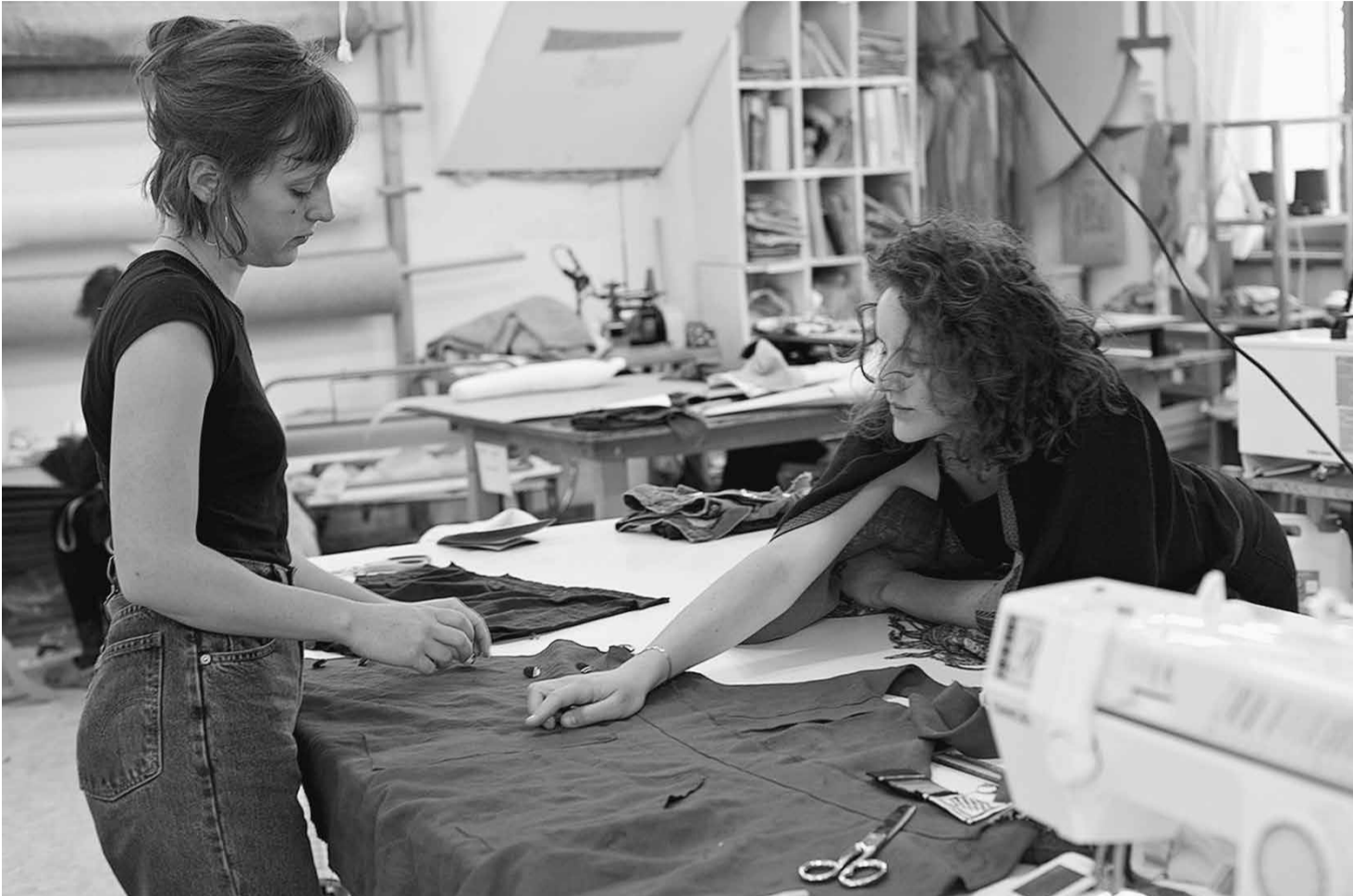
Cursus kleding maken in de spinnerij van Chantemerle: met de nodige uitleg zelf uitproberen is de beste leer methode.