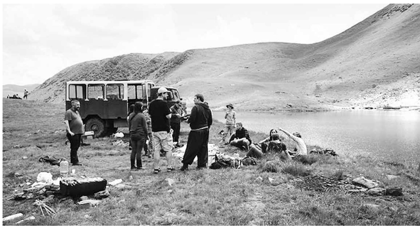
Pauze in het nu nog prachtige berggebied Svydovets: de internationale delegatie, begeleid door leden van comité Free Svydovets.