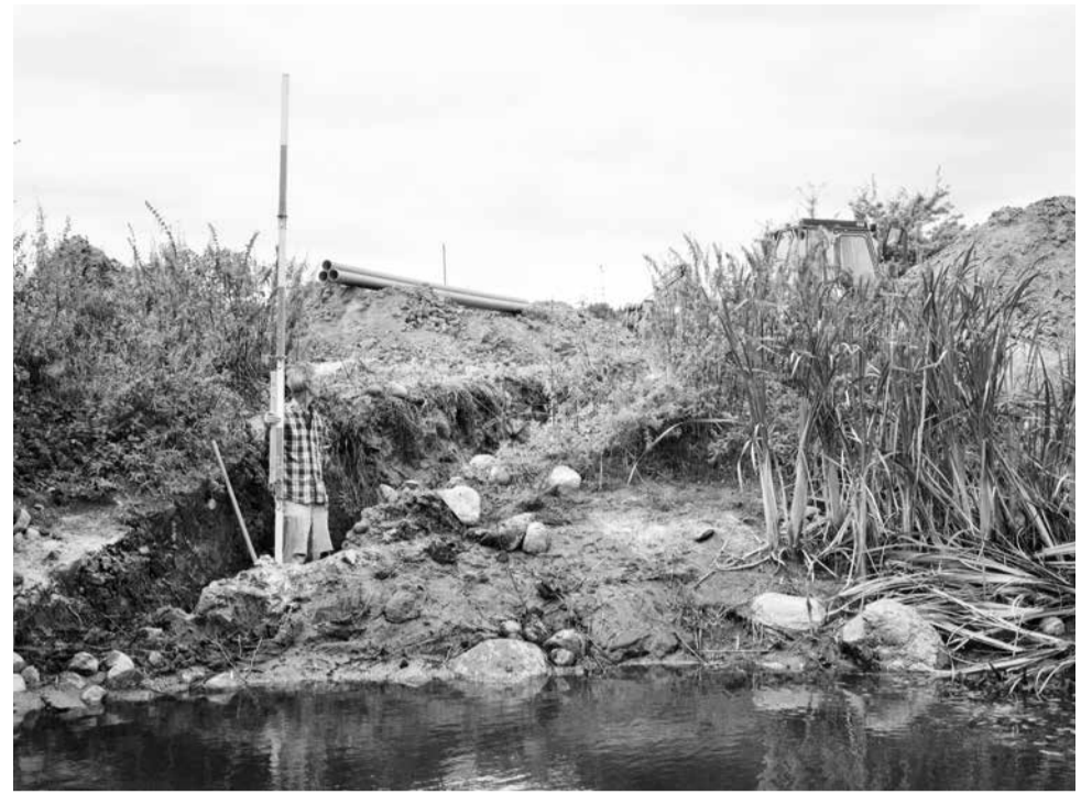
Te veel water: de reparatie en vervanging van delen van het oude drainagesysteem moet uitkomst brengen.

Sinds enkele jaren veroorzaken de extreme weersomstandigheden problemen in de hele streek en ook op de boerderij. De slechte toestand van het ontwateringssysteem versterken deze problemen. We laveren tussen periodes met te veel water en periodes met te weinig water. De winters komen laat en zijn over het algemeen te warm, de aarde bevriest niet genoeg. In het bos blijft de grond moerassig en het houthakken lijkt op een modderbad, dat de bosgrond meer schaadt dan goed voor ze is. In de herfst gaan de dieren vaak vroeg de stal in en in de lente komen ze er laat uit om de moerassige weiden te beschermen. Ook de trekker kan op zulke weiden grote schade aanrichten. En waait het dan weer en is het weer droog, waardoor de weiden weer begaanbaar worden, dan lijdt de tuin daar weer onder. We besproeien steeds vroeger in het jaar met water dat we eigenlijk voor de zomermaanden moeten bewaren. De verschillende situaties op ons