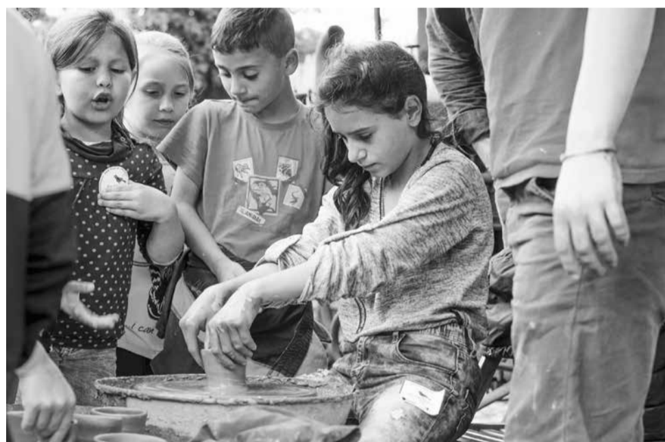
Creatief bezig zijn: ook kinderen doen mee bij de cursus pottenbakken in Hosman.