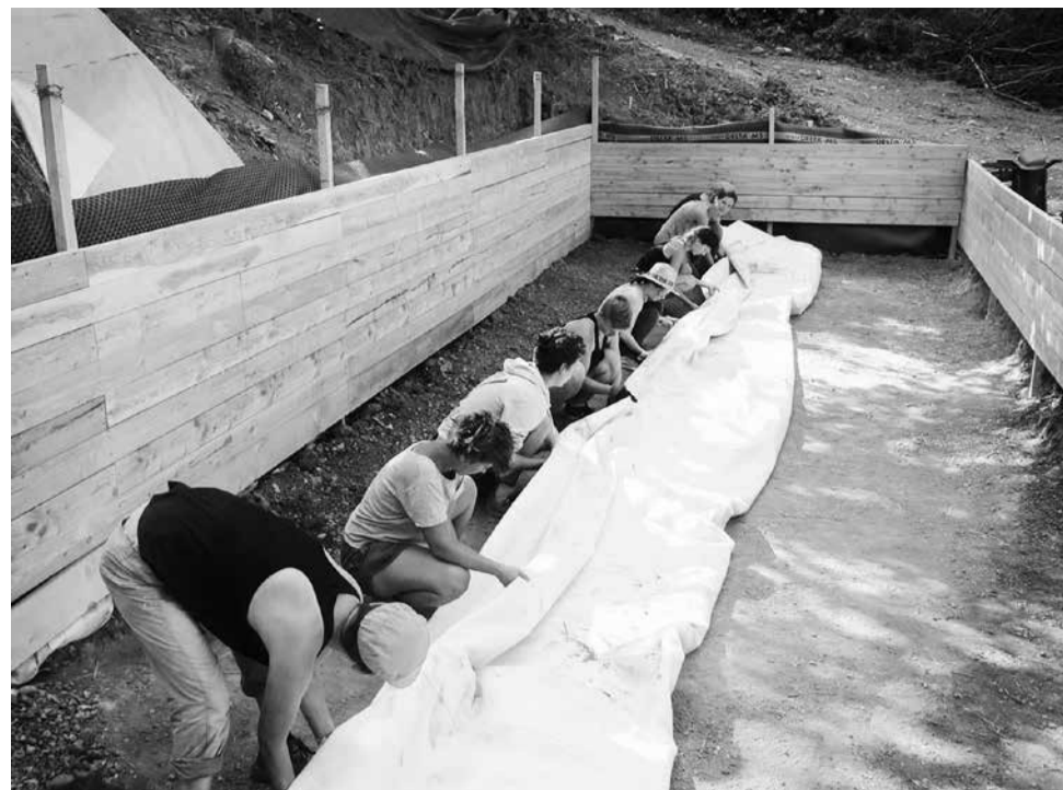
Vrouwenpower in de Franse Alpen: het zeil voor de waterzuiveringsinstallatie met moerasfilter wordt gelegd.