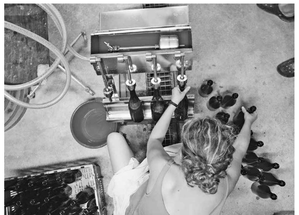
Na de natuurlijke fermentatie wordt de wijn gebotteld.