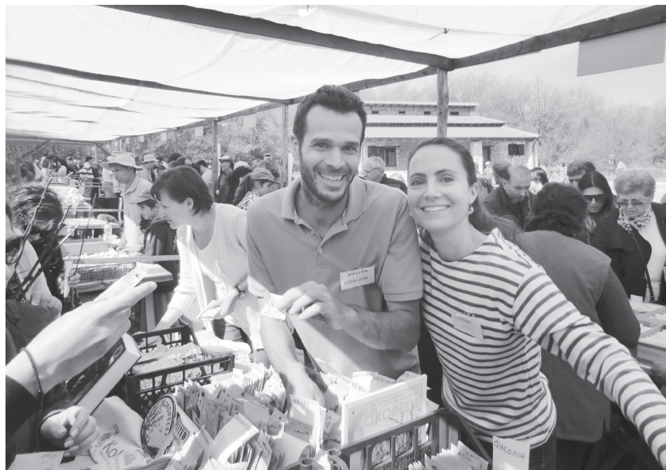
Op het zaaigoedfestival van Peliti kunnen de bezoekers gratis zakjes zaaigoed meeneemen. Ook de vertegenwoordigers van zaaigoedverenigingen uit het buitenland zoeken hier graag naar nieuwigheden. Op de achtergrond is het nieuwe zaaigoedhuis te zien.

binnen het netwerk van Via Campesina. Helaas kunnen we geen grote hoeveelheden graan brengen. Met groentezaad is dat anders. In ons netwerk ruilen we sinds lang zaaigoed en we weten hoe we het moeten vermeerderen. We kunnen de Syrische bevolking gevarieerd en zaaivast zaaigoed aanbieden. De mensen met wie we samenwerken hebben nagevraagd welk zaaigoed het meest geschikt is. Ook in Syrië was de landbouw grootschalig en geïndustrialiseerd. Veel mensen weten niet meer hoe ze gewassen kunnen telen en er ook weer zaaigoed uit kunnen halen. Dat is een belangrijk punt in onze discussies, hoe we deze kennis kunnen doorgeven. Elke twee of drie maanden komen we bij de grens bij elkaar voor deze workshops. We willen ook handleidingen samenstellen, niet alleen over zaaigoedwinning, maar ook over de verbouw van gewassen, compost, vruchtwisseling... In Syrië bestaat een goed netwerk van zelfstandige radio-stations. Het hoe en wat van tuinbouw wordt nu via hen verspreid. Peliti draagt veel bij aan deze solidariteitsactie. Ze geven veel zaaigoed en maken extra tuinen om zaaigoed voor Syrië te produceren. Dat is belangrijk, want Griekenland ligt in dezelfde klimaatzone als Syrië. We verzamelen trouwens ook zaaigoed