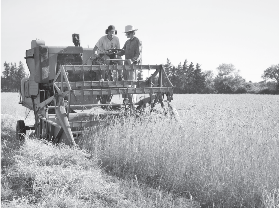
Met een kleine combine worden de verschillende soorten graan geoogst.

Een kwart eeuw geleden kwam Longo maï aan in de Zuidfranse Crau-vlakte en bracht weer leven op de Mas de Granier.