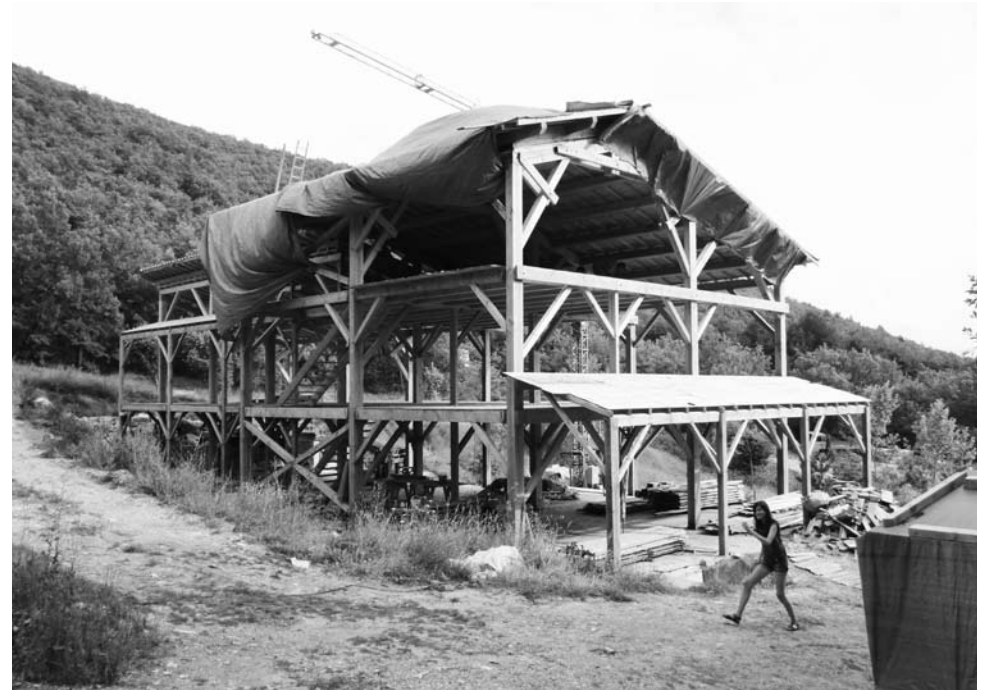
Het nieuwe gemeenschappelijke huis tussen de Pigeonnier en Grange neuve in de Provence. Bij deze bouw komt al het hout voor het vakwerk en de dakstoel uit de bossen van Zuid-Frankrijk.

Onlangs werd hier een nieuwe bedreiging aan toegevoegd: de bevlaging van hout als energiebron - maar dan wel meteen op groot-industrieel niveau. Een voorbeeld daarvan zit bij ons in de buurt. Het Duitse energiebedrijf E.On wil in Gardanne bij Marseille een biomassacentrale bouwen. Deze centrale zal ongeveer een miljoen ton biomassa per jaar nodig hebben, waaronder landbouwafval, snoeiafval en vooral 'hout uit het bos' oftewel bomen. Om te beginnen wil E.On daarvan de helft importeren, waarschijnlijk uit Canada, wat rampzalige gevolgen voor de noordelijke bossen zal hebben.