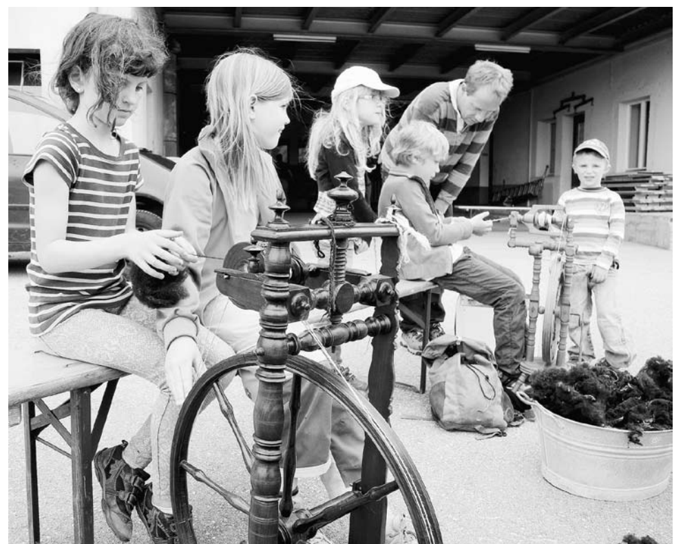
Kinderen konden op de woldag in de Zwitserse Jura leren spinnen.