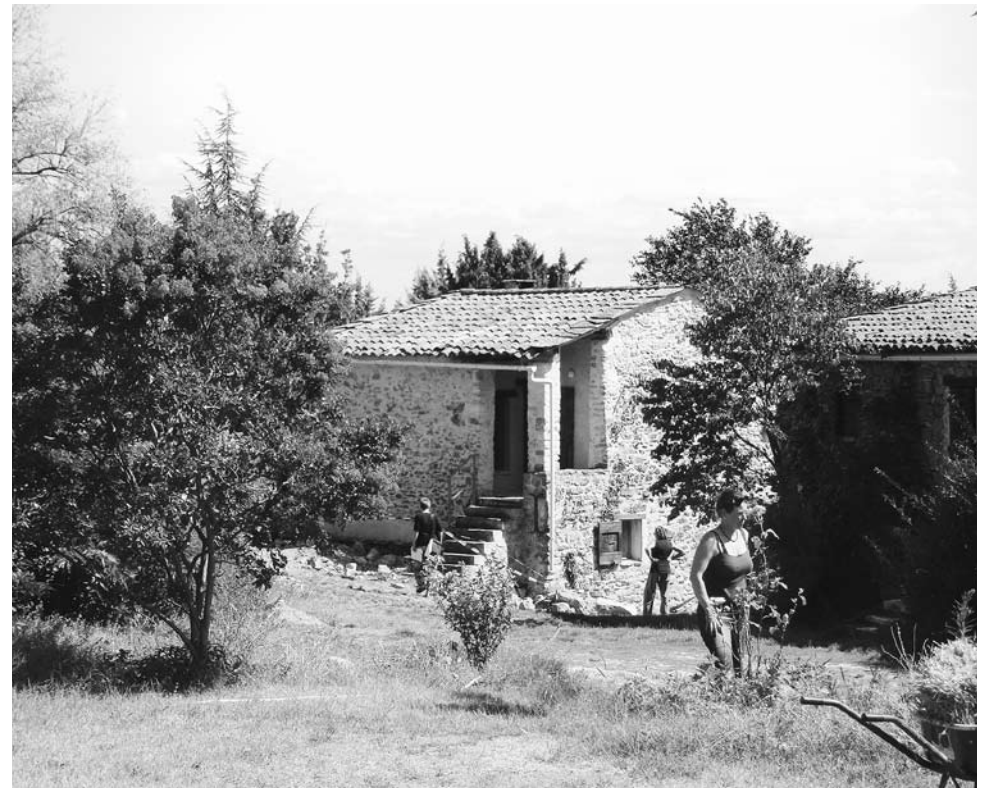
Een van de vakantiehuisjes in Les Magnans wordt gerestaureerd. Komend voorjaar kunnen er weer gasten in.

Hof Stopar, Lobnik 16 A-9135 Eisenkappel Tel. 0043 4238 8705