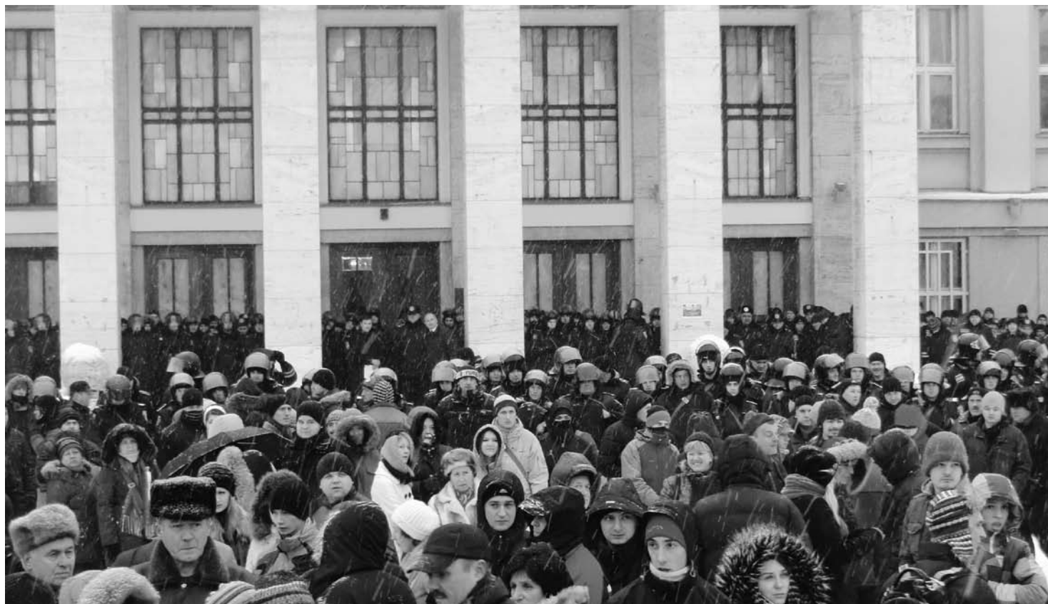
Eind januari 2014 in Oesjgorod, Transkarpatië: protest van de bevolking voor het parlamentsgebouw tegen corruptie en machtsmisbruik.

De situatie in de Oekraïne houdt ons bezig. Het beeld dat men krijgt, hangt af van welk journaal men kijkt en welke krant men leest: ze geven allemaal een ander beeld van het gebeuren. Hieronder een samenvatting van een telefoongesprek van 20 augustus met Oreste Del Sol, die sinds twintig jaar in Transkarpatië woont en deel uitmaakt van de Longo maï-groep in Zeleniy Haj.