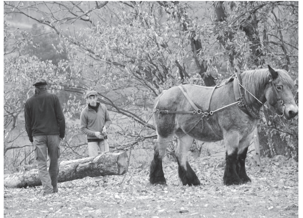
Uitleg van Florent tijdens een cursus houtslepen met paarden.

Afgelopen herfst dunden we meerdere percelen sparren uit. Zo scheppen we lichtere plaatsen in het bos,