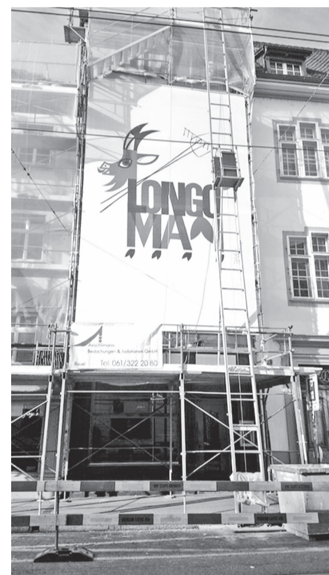
Bij de renovatie van het Longo maï-huis in Bazel hebben we de stellingen bedekt met een grote kopie van Piatti's lithografie.