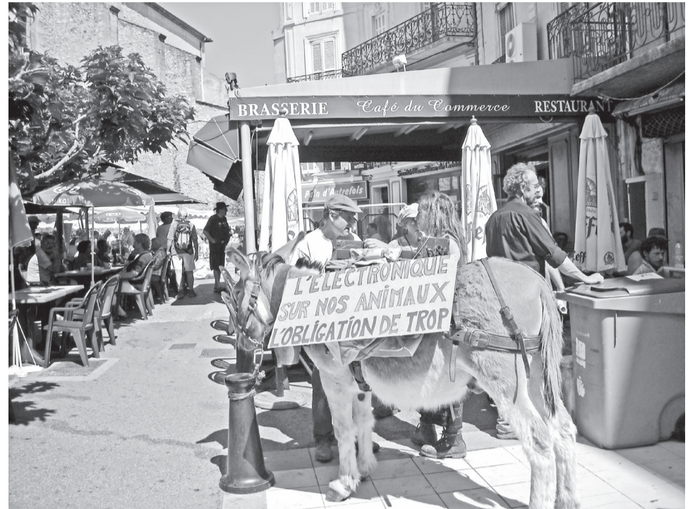
De ezelin Georgette en de schapefokkers informeren de burgemeester van de stad Forcalquier in de Alpes de Haute Provence over de nieuwe regelgeving en roepen hem op hun protest tegen de elektronische identificatie te steunen.

In de Europese Unie bestaat sinds 2010 de elektronische identificatie- en registratieregeling voor schapen en geiten. In juli 2013 moeten alle dieren een elektronisch merkteken hebben. Vooral kleine veetelers hebben hier geen voordeel bij en zijn bang voor de consequenties.