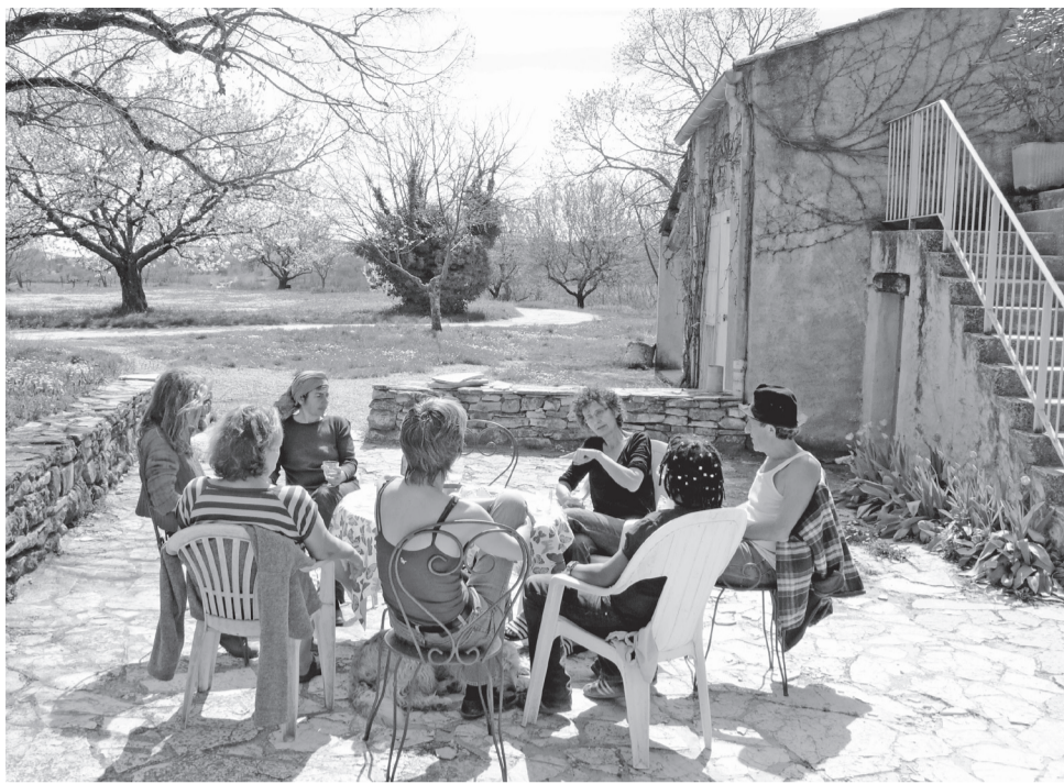
Werkbespreking van het ontvangstcomité van het vakantiedorp