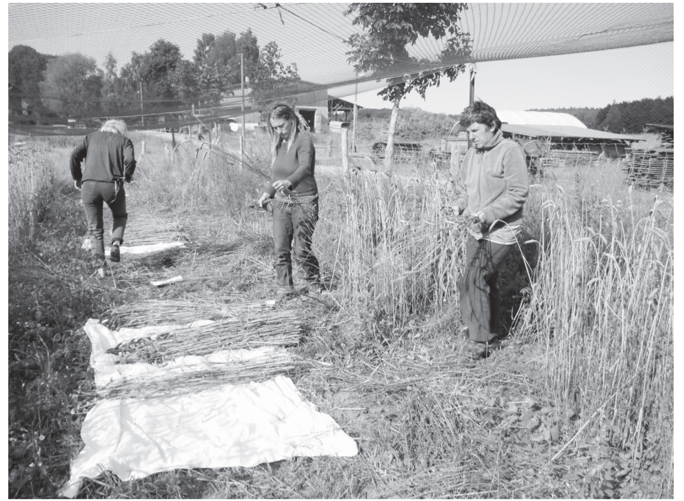
De kijktuin met oude graansoorten op Hof Ulenkrug in Mecklenburg. Elk jaar oogsten we met de hand rond de honderd verschillende graansoorten uit de collectie van het Noodcomité voor het behoud van de tarwediversiteit.