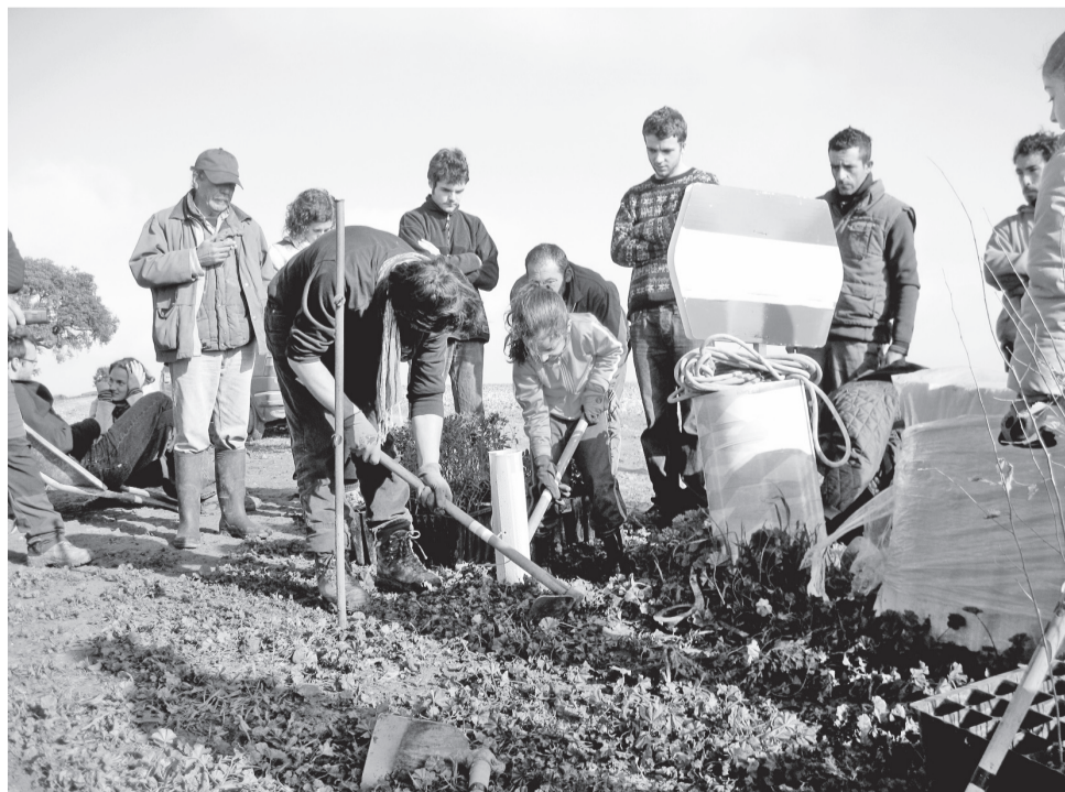
Een kind plant een boom op de finca Somonte: een voorschot op de toekomst.