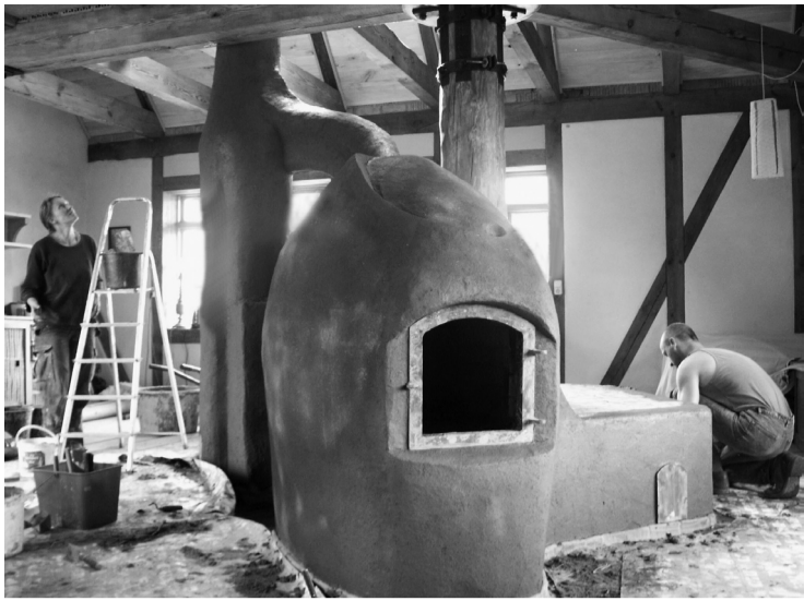
Hof Ulenkrug, mei 2007: De laatste werkzaamheden aan de leemkachel in het nieuwe gemeenschappelijke huis.