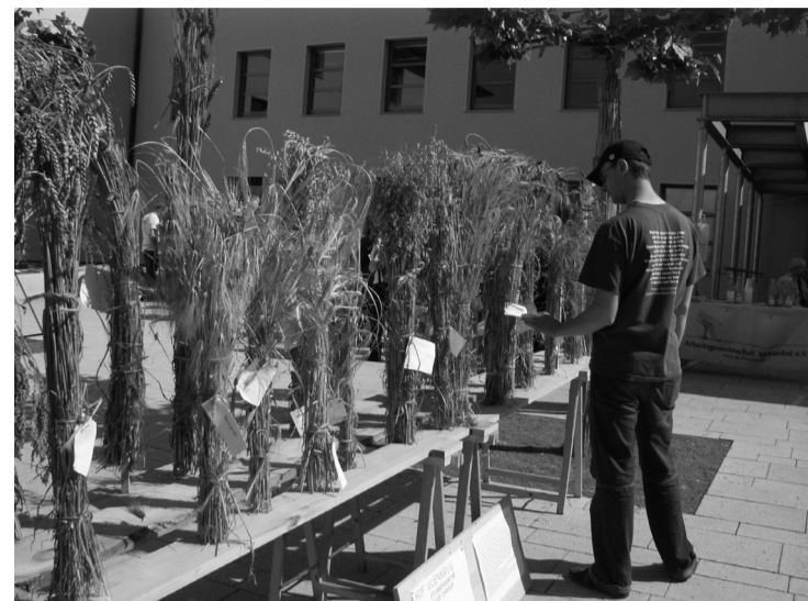
Tentoonstelling van verschillende granen uit de Ulenkrug tijdens de zaadgoedbeurs op 20 mei in Halle/Saale

Toch houdt de Europese politiek vast aan productiviteit en kortlopende winst en denkt daarbij niet aan de rol die de boeren economie in Europa met betrekking tot de sociale en culturele identiteit en het milieu altijd heeft gespeeld. In Zwitserland hebben de grote agrarische verbanden deze oriëntatie niet ter discussie gesteld. Alleen de kleine boerenverbond Uniterre stelt nadrukkelijk dat er meer boeren nodig zijn. Met de petitie hebben we bijgedragen aan de nodige verdieping van de discussie over onze levensmiddelenbasis. Ieder van ons kan door zijn houding de manier van agrarische productie tot op een zekere graad beïnvloeden. We besluiten zelf wat we kopen of verbouwen. Steeds meer mensen kopen direct bij de boer of via levensmiddelencoöperaties. In het westen van Zwitserland en in Frankrijk is in de laatste jaren de verdragslandbouw ontstaan. Consumenten bestellen bij boeren de producten die ze gedurende het jaar nodig hebben en garanderen de afzet en een vaste beloning. Een diverse, kleinschalige productie in onze buurt is de beste basis voor een leven, dat niet ten koste van de ander gaat.