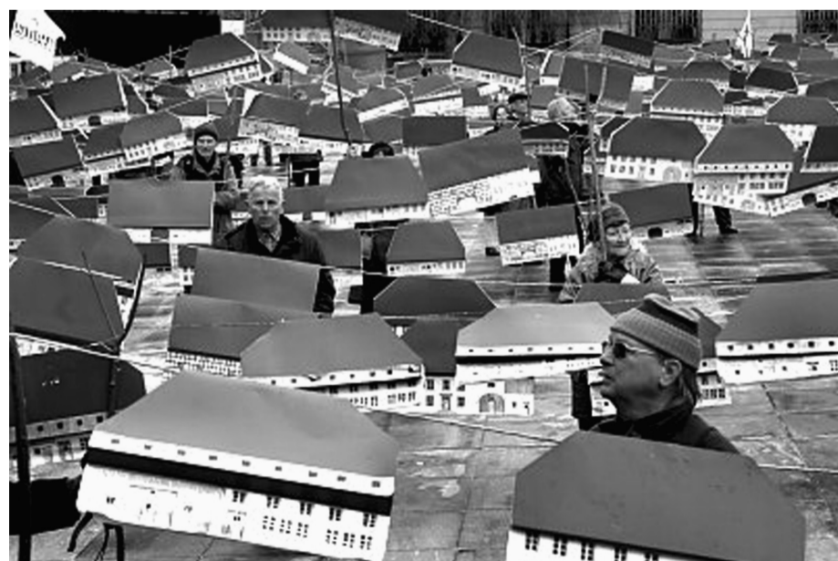
Februari 2007: een symbolische actie met 2000 kartonnen boerderijen bij de overhandiging van de petitie tegen de nieuwe landbouwwet

Op 22 december 2006 werd de vereniging Kokopelli door het hoger gerechtshof in Nîmes (departement le Gard) schuldig verklaard aan illegale verkoop van zaad. Deze uitspraak dreigt de vereniging en het tienjarige werk kapot te maken. Ze moeten 20.000 euro plus de rechtskosten betalen. De veroordeling van de vereniging laat de onverbiddelijkheid zien van de wetgeving, die vooral de belangen van de zaadgoedconcerns te goede komt. Zo wordt een vereniging het bestaan onmogelijk gemaakt, die niets anders doet dan oude kennis bewaren. Nog steeds valt 70% van het zaadgoed op de wereld buiten het monopolie van de concerns. Maar de vrijheid van de boeren, die hun zaadgoed nog zelf controleren, is bedreigd. In 2006 ontmoetten we mensen van verschillende zaadgoedinitiatieven in Zwitserland, Spanje, Portugal, Italië, Oostenrijk en