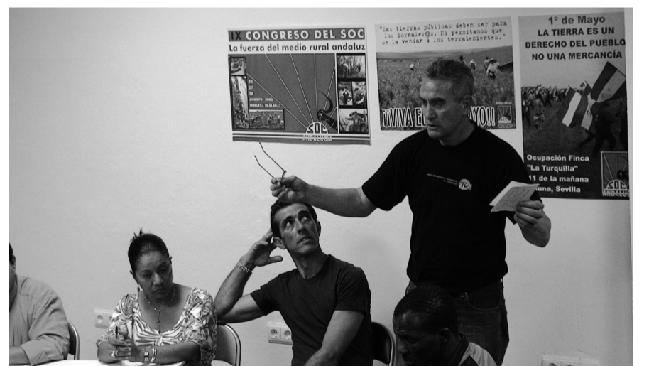
Een discussie in het nieuwe vakbondscentrum

een campagne beginnen om de situatie in Andalusië meer bekendheid te geven en steun te organiseren. Gedacht wordt aan acties bij supermarkten, de organisatie van debatten, waarbij ook de kwalijke rol van de grossiers en levensmiddelenketens aan de orde zal komen. Fototentoonstellingen en filmvertoningen moeten het leven van de landarbeiders dichterbij brengen. Hoewel een consumentenboycot op de lange termijn het enige is wat iets aan hun situatie kan veranderen, zullen we daartoe nu nog niet oproepen omdat de migranten dat zelf niet willen. We kiezen daarom voor steun aan de mensen die in het gebied zelf actie voeren tegen deze moderne slavernij.