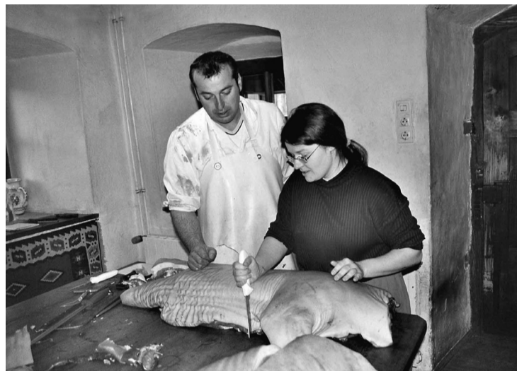
Stage in de vleesverwerking op Hof Stopar met deelnemers uit Transkarpatië

ziekgroep »Hudaki« en het koor »Cantus«. Op dit moment vindt er een nieuwe oriëntatie van het hele project plaats: de koop van 3 hectare land »Zeleniy Haj« opent nieuwe perspectieven in de landbouw, vooral op het gebied van veeteelt en vleesverwerking.