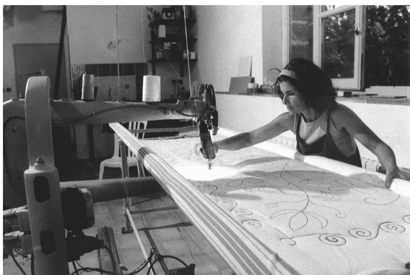
Fabricatie van gestikte dekens met wol of ganzedons in het textielatelier op de Pigeonnier

solidaire samenwerking tussen fokkers, scheerders en wolverwerkers. Vorig jaar vierde de spinnerij, de laatste fabriek van deze soort in het Alpengebied, haar 30-jarig jubileum. De spinnerij produceert haar eigen stroom op waterkracht en is begonnen met de vernieuwing van de technische installatie. Dat zal leiden tot efficiënter energiegebruik.