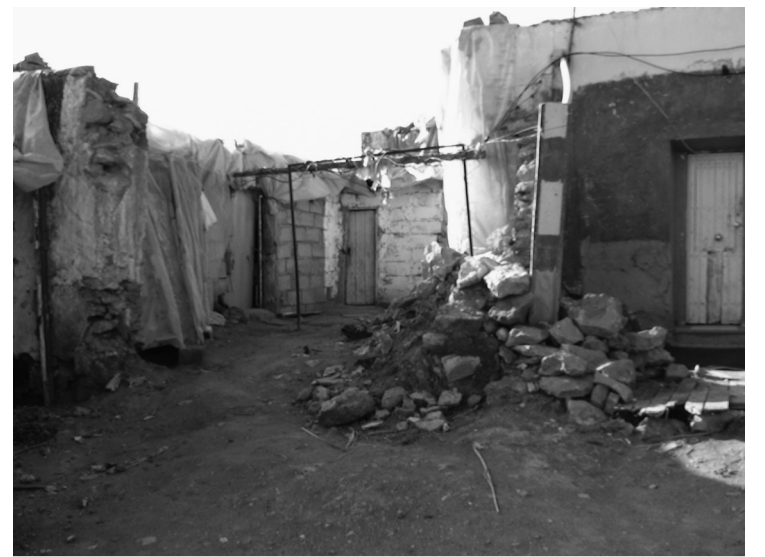
Chabolas en verlaten stenen hutten dienen als onderdak

Sinds de rassenrellen tegen Marokkaanse migranten in El Ejido in februari 2000 is de SOC ook actief in de plastic kassenzee. Ze ondersteunt de buitenlandse arbeiders ondanks de weerstand van de lokale ambtenaren en de vijandige sfeer onder grote delen van de bevolking. Het accent van het werk ligt op de zelforganisatie van de migranten, hoe moeilijk dit werk ook is. Door de grote fluctuatie is het erg ingewikkeld mensen te organiseren. Is er eindelijk een vertrouwensman in een bedrijf gevonden, moet die weer ergens anders gaan werken. Bij de onderhandelingen met de werkgevers om looneisen en andere twistpunten worden er echter toch successen geboekt. Het Burgerforum en