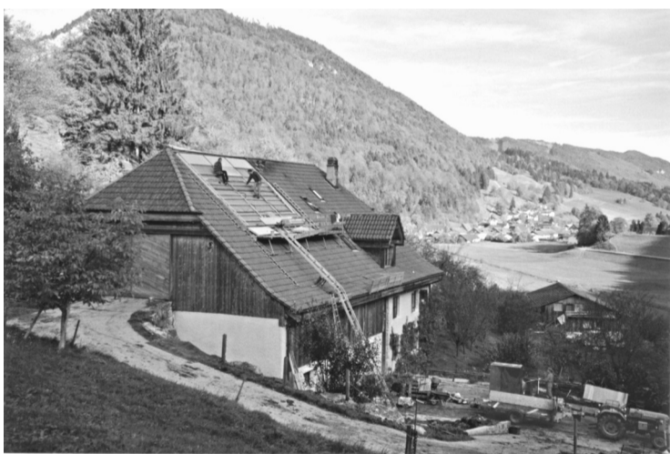
Installatie van de zonnecollectoren op het dak van de Montois

en onderwijzend personeel van meer dan dertig scholen over regionale en taalgrenzen heen zich inzetten voor het behoud van de tweetalige kleine scholen. Door het lidmaatschap in het bestuur van de Oostenrijkse bergboerenvereniging en contacten met de Europese boerencoördinatie CPE is de uitwisseling met agrarische kringen in binnen- en buitenland rond het thema van het behoud van de kleinschalige landbouw zeer groot. Dit jaar vieren we het 30-jarig bestaan van Hof Stopar met een feest op 1 september met de muziekgroep Comedia Mundi. U bent van harte uitgenodigd!