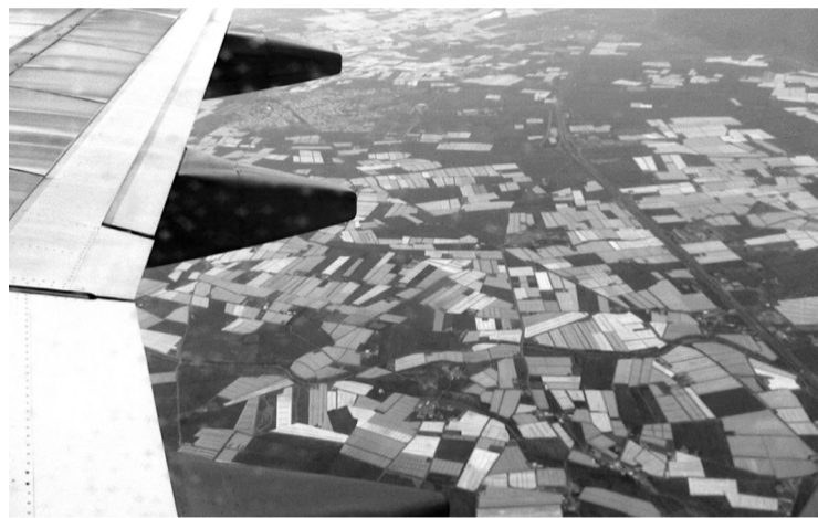
De zee van plastic kassen van Almeria, gezien vanuit het vliegtuig

erbarmelijke omstandigheden. Overuren worden vaak niet betaald. Wie nog loon tegoed heeft, kan dat alleen opeisen als hij geldige papieren heeft. Van beschermende kleding die gedragen zou moeten worden bij de