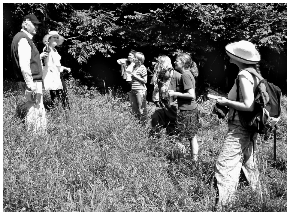
Nieuwsgierige cursusdeelnemers zoeken naar medicinale kruiden op de bergweiden in het Oostenrijkse Karinthië

Wie toevallig op 8 november in Bazel is, is hartelijk uitgenodigd voor de officiële inwijding. We beginnen met een glaasje om 18.00 uur!