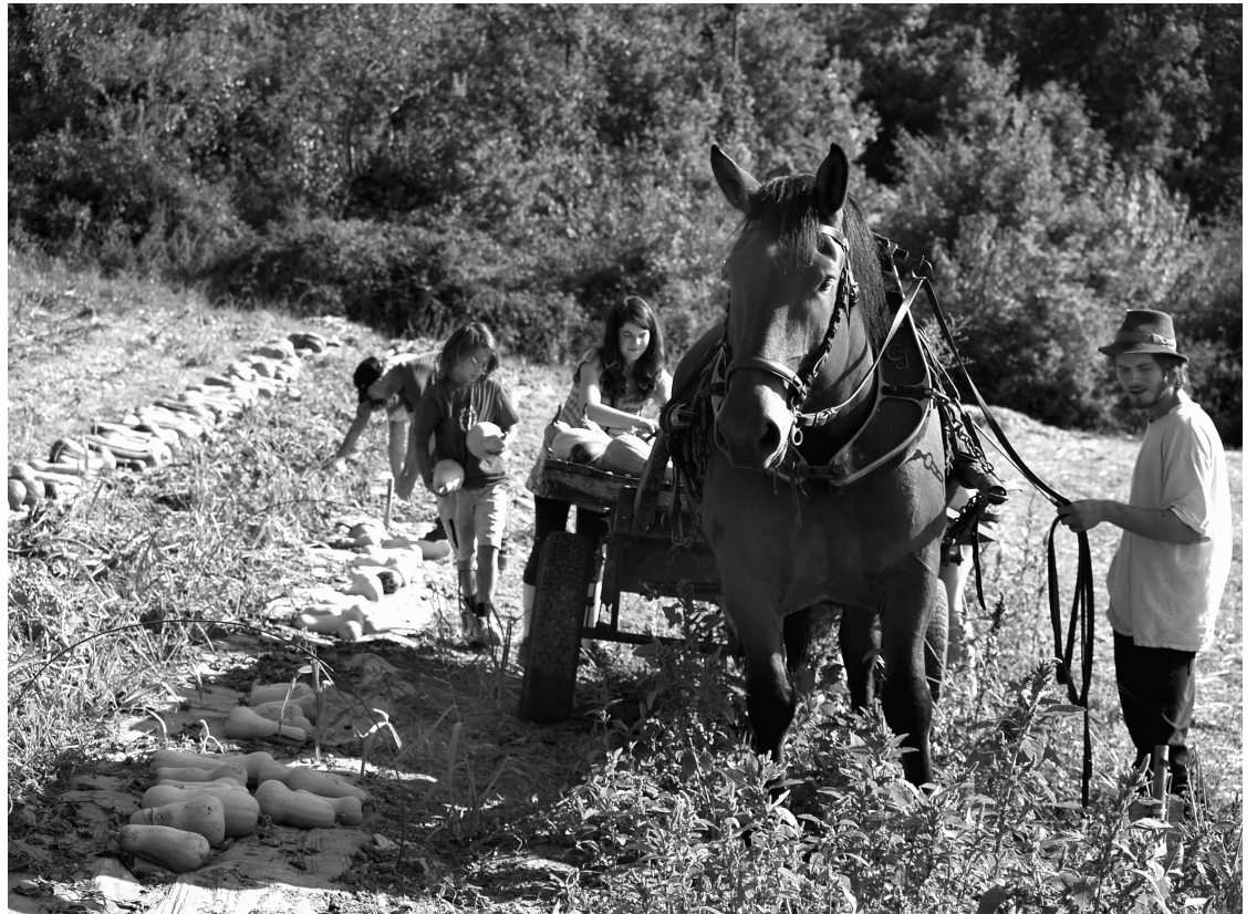
De pompoenenogst met paard en wagen in de coöperatie bij Limans in de Provence

In hetzelfde rapport constateert de FAO ook, dat alleen al in Oost-Europa en in Rusland 13 miljoen hectare land braak liggen. Als “noodhulp” voor de wereld en om grip te krijgen op de actuele crisis, zouden de braakliggende velden in gebruik moeten worden