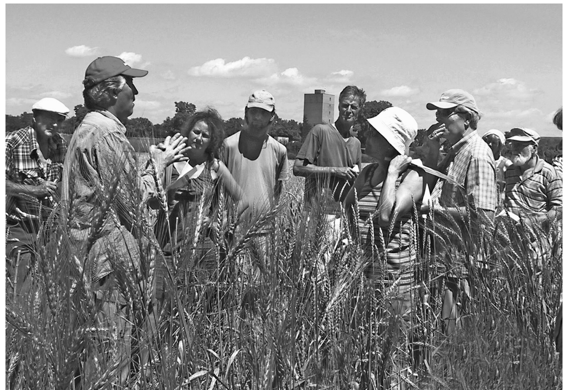
Op de velden in Rheinau vonden boeiende gesprekken plaats over de oorsprong en de ontwikkeling van de tarwe

Dit jaar werden wij op onze beurt uitgenodigd naar Oostenrijk te komen. Met negen vrouwen uit Nisjné kwamen we op 1 juni aan op de boerderij Stopar in de Karinthische Karawanken. We waren natuurlijk gelukkig elkaar weer te zien. We leerden de vegetatie in deze voor ons zeer westelijke streek kennen, wisselden recepten met elkaar uit, luisterden naar ieders ervaringen, roerden zalfjes, zetten tincturen en oliën aan. Enkele Zwitsers kookten zelfs een soep uit deze ingrediënten, ongetwijfeld erg gezond, maar over de smaak zeg ik maar