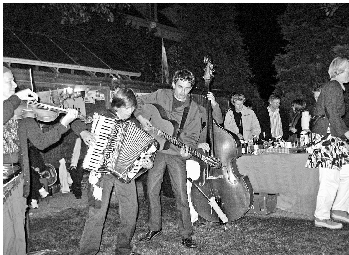
Feestelijke sfeer met Comedia Mundi in de tuin van Omslag in Eindhoven

Zo'n zeventig mensen uit heel Nederland namen zaterdag 23 augustus deel aan de informatiedag over Longo mai, die werd afgesloten met een openluchtoptraden van Longo mai's muziekgroep Comedia Mundi.