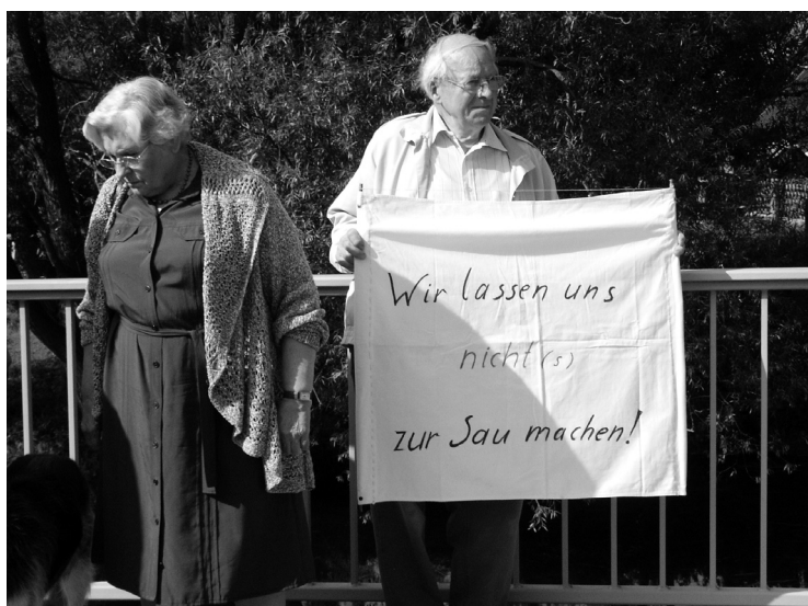
Eens jong, altijd jong; protest in het Duitse Mecklenburg tegen de installatie van een nieuwe varkensfokkerij - zie pagina 3